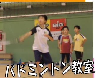
バドミントン教室