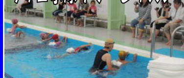
ラッコ水泳サマーレッスン