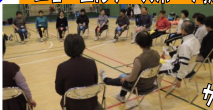
ニューエルダースポーツ教室