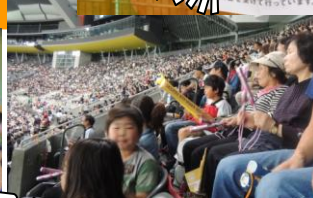
日ハム観戦ツアー