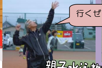
初心者テニス教室