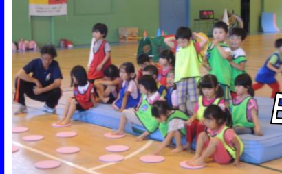
キッズ☆ビートスポーツ教室