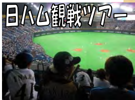
日ハム観戦ツアー