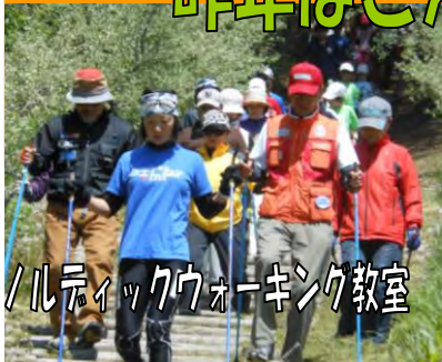
ノルディックウォーキング教室