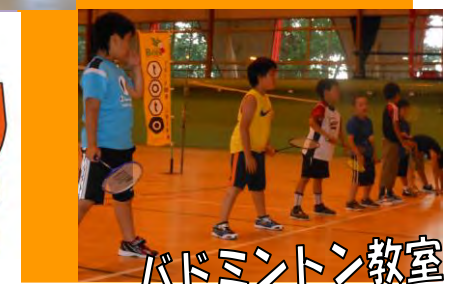
バドミントン教室