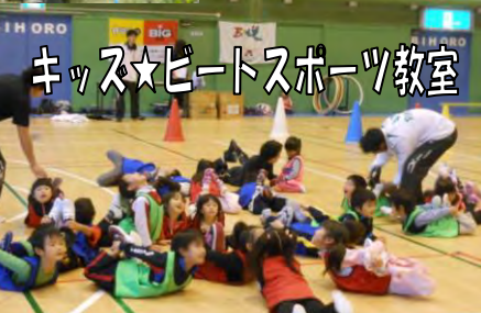
キッズ☆ビートスポーツ教室