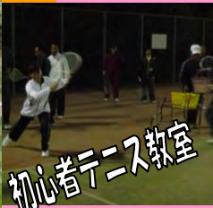
初心者テニス教室