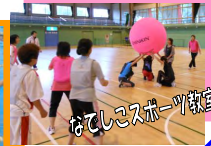
なでしこスポーツ教室