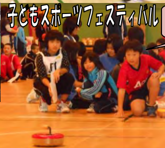
子どもスポーツフェスティバル